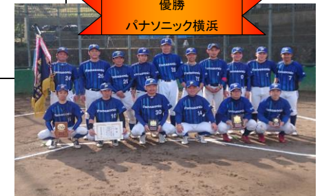
優勝 パナソニック横浜